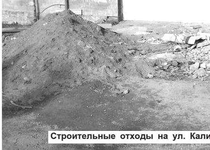
Строительные отходы на ул. Калинина

министрации, предпринимателям было предложено установить один контейнер и заключить договор с коммунальной службой о регулярном вывозе мусора. С этим предложением специалисты горадминистрации обратились к владельцам магазина «Березка», салона красоты «Креатив» и встретили одобрение и понимание как со стороны самих хозяев, так и сотрудников.