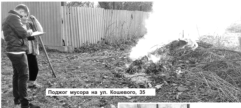
Поджог мусора на ул. Кошевого, 35

Очередной рейд по мониторингу санитарного состояния улиц города и особенно прилегающих к объектам торговли территорий, провели представители районной и городской администраций, райотдела полиции, Собрании представителей района, административной комиссии, МП «Благоустройство», общественной организации «ФАТ». Участники рейда проинспектировали все торговые точки, а также строящиеся объекты, расположенные на улице Пролетарской и Бр.Дзугаевых — до Красногорского перекрестка. Результат работы наглядно показал, что в решении вопросов, касающихся санитарного состояния города, а также ликвидации фактов несанкционированной торговли на улицах, сделано немало, но есть еще над чем работать.